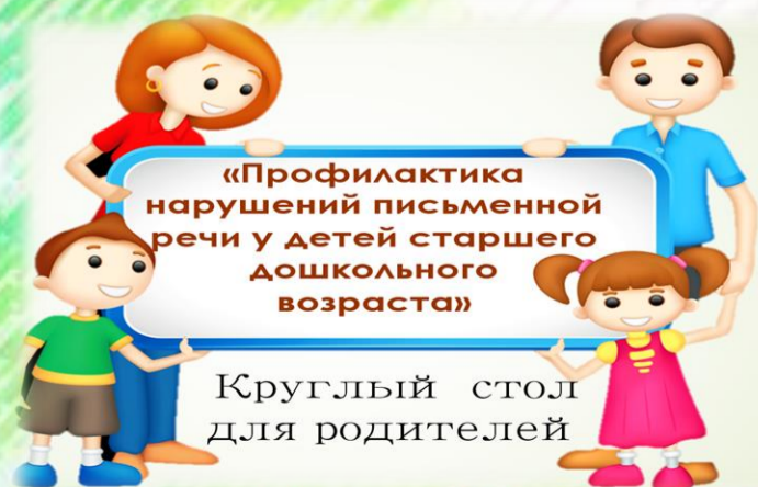
Презентация круглого стола